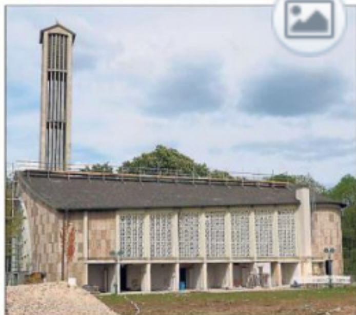
An der Südseite der profanierten Kirche St. Martin entsteht auf alten Abmaßen ein Anbau für die Gruppenräume.

Interessant ist für das Hammer Unternehmen Heckmann Bauland & Wohnraum nicht alleine der Umbau einer Kirche in Beckum, sondern auch die dazugehörige Fläche am Mühlenweg. Das Pfarrhaus und ein Wohngebäude im Süden der profanierten Kirche St. Martin wurden abgerissen. Entstehen sollen dort laut Reinhold Gierse sechs Gebäude mit 56 barrierefreien Eigentumswohnungen und Tiefgarage. Investitionssumme: 16 Millionen Euro. Der Verkauf der 65 bis 110 Quadratmeter großen Wohnungen soll im Juni starten. Der Baubeginn ist für Herbst anvisiert, Fertigstellung soll nach eineinhalb bis zwei Jahren sein. (wit)