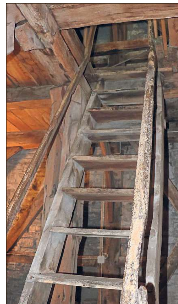
Ein steiler Aufstieg: Mehrere hölzerne Treppen führen in den Glockenturm der St.-Stephanus-Kirche hinauf.