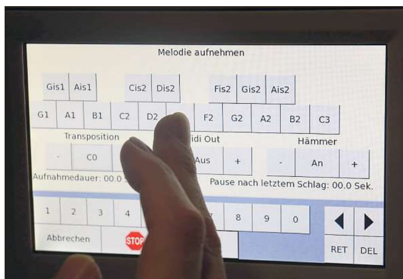
Über ein kleines Display können die Glocken zum Klingen gebracht und Melodien gespeichert werden.